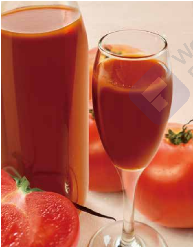
農家さん家のトマトジュース (グラス) 330円 (ボトル) 1,900円