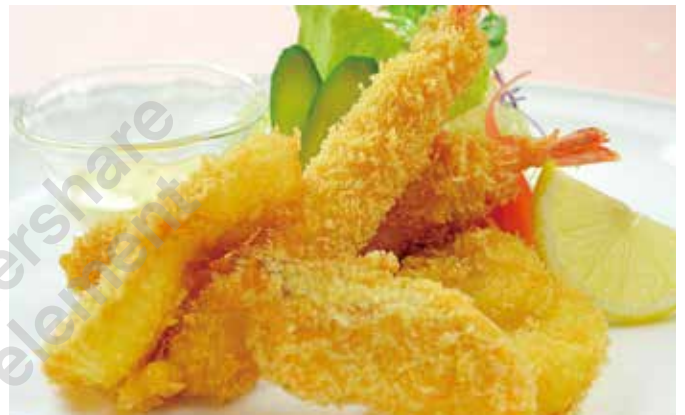
ミックスフライ 1,500円🔒 ホタテ・サーモン・エビなど。サラダ付き。 ※仕入れ状況により内容が異なる場合があります。