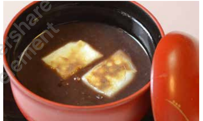
おしるこ(自家製あんこ) 250円