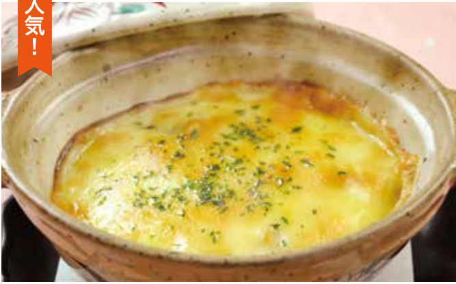
かぼちゃグラタン 550円 ちよっぴり甘め。北海道産かぼちゃ使用。