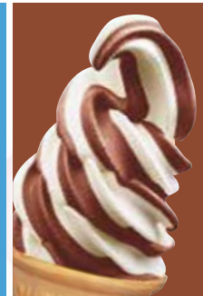
バニラ& チョコレート