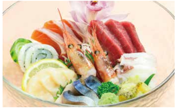
刺身盛り合わせ 2,000円 ※仕入れ状況により内容が異なる場合があります。