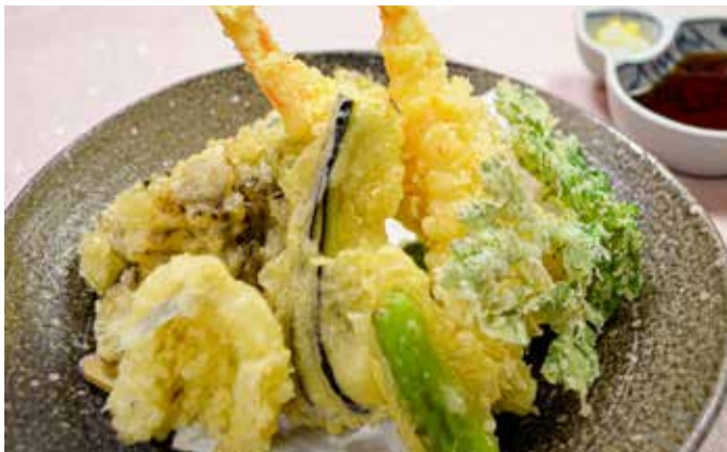
天ぷら盛り合わせ 1,240円🔒 ※内容は予告なく変更します。