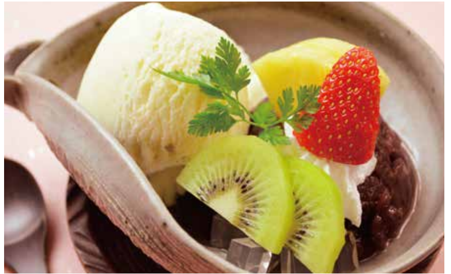
クリームあんみつ